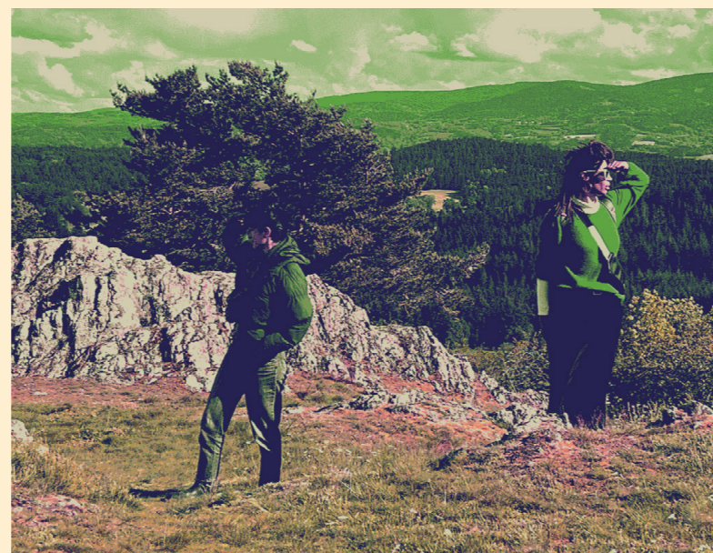
1. Pina-Wood 2. Balle-Perdue 3. OLA

Licences : n°2 -PLATESV-R-2020-003504 et n°3 - PLATESV-R-2020-003504 Organisme de formation n°82 42 01 03 842